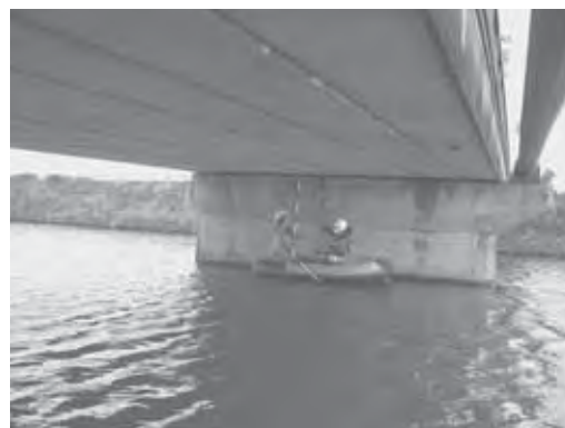
点検の様子（脇田橋）

点検結果を基に平成22年度に橋梁長寿命化修繕計画を策定し橋梁の健全な維持管理に努めてまいります。