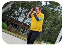
事業中の様子の撮影・記録 広報活動