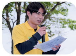
様々なイベントでの 司会進行