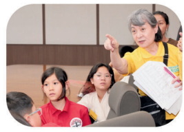
通訳・翻訳ボランティア