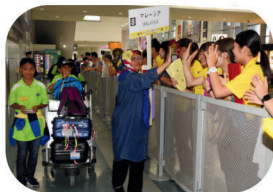
空港にて海外の子ども達の 出入国サポート