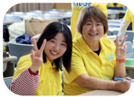
新規ボランティア登録会や ボランティア交流会のサポート