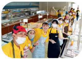
子ども達が体調を整えながら 日本の生活に慣れるためのサポート