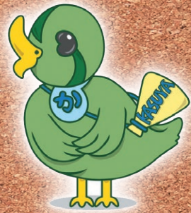
粕屋町議会イメージキャラクター 「かすカモ」