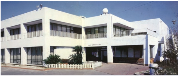
柚須文化センター

この要綱では6項目の基本事業と3項目の特別事業が例示されています。厚労省要求の設置要綱の中身は、高度でレベルが違います。社会福祉協議会の福祉事業に匹敵しません。今の容量では不足です。福祉事務所を粕屋町西部地域にとりあえずはありですか。