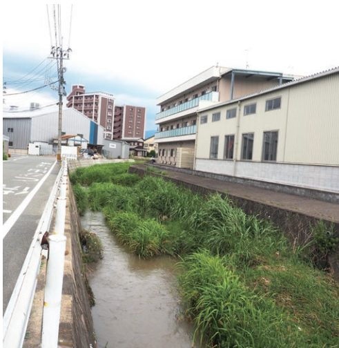
仲原川の浚渫・護岸改修区域

仲原川の浚渫については、令和2年度に作成しました仲原川の浚渫計画に基づいて本年度、第1期工事として乙仲原西区『子ども広場』の西側付近、左岸の護岸工事を15.5m、コンクリート矢板護岸の改良工事を行います。 その工事に合わせて約220mの浚渫工事を予定しています。また、次年度以降は予算を確保して、護岸の改良及び浚渫を実施していきます。